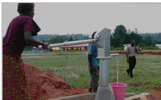
Brunn och vattenförsörjning på skolan i Kiminini.