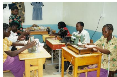
Faith Homes sömnadsskola

Yrkesutbildningar – Faith Homes erbjuder yrkesutbildningar på fyra platser; Makutano i West Pokot distrikt (sömnad, bilmekaniker), Nzoia i Bungoma distrikt (sömnad), samt Nairobi (sömnad, sekreterare, data). Distrikten West Pokot, och Bungoma ligger i de västra och nordvästra delarna av Kenya.