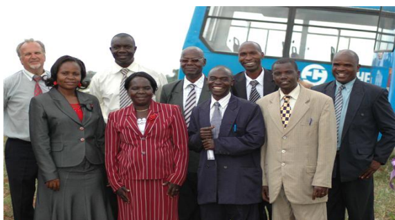
Den kenyanska styrelsen